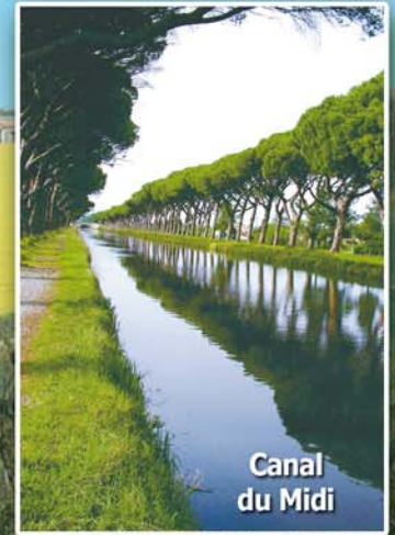
Canal du Midi