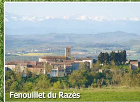
Fenouillet du Razès

Randonnées (GR7) Tennis (2 km) Piscine (12 km) Equitation (15 km) Canoe Kayak (35 km)